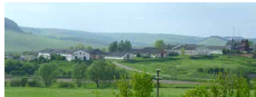
Ukraine: Potutory Initiative

men. Dies wird wohl noch einige Zeit dauern und viel Umdenken verlangen.