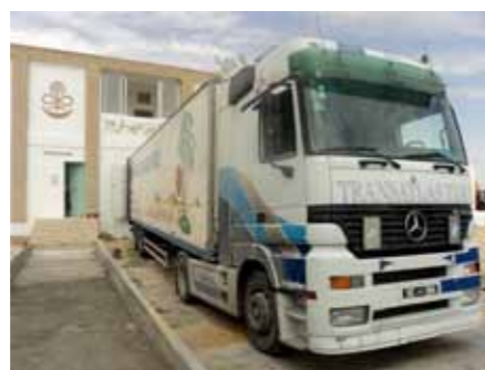
Dattelerlad ab der Verarbeitungsstation in Hazoua

Für die europäische Vermarktung und die Erneuerung der geforderten ISO-Zertifizierung muss die Verarbeitungsstation umgebaut und vergrössert werden. Nach