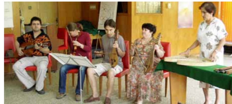
AbsolventInnen beim Musizieren